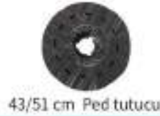
43/51 cm Ped tutucu