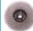
43/51 cm Halı Fırçası