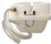
15 litre su haznesi