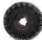
43/51 cm Fırça